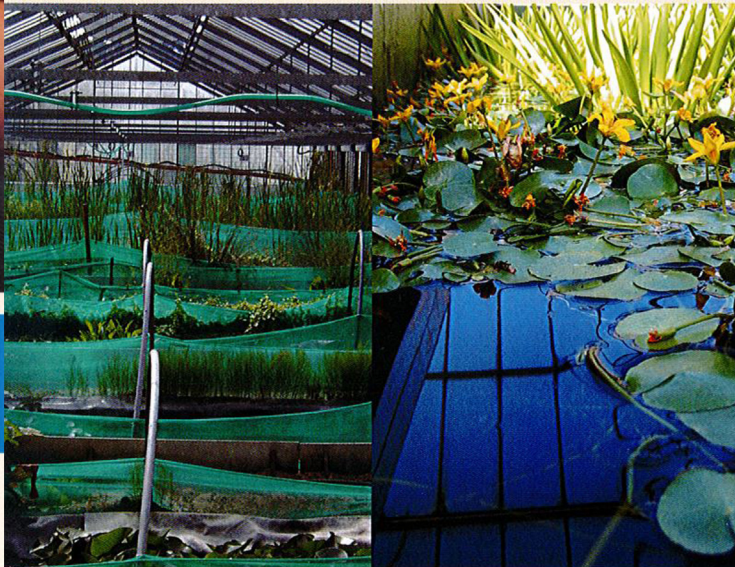
Blick auf die naturnahen Teiche in der Biebertaler Blutegelzucht. Diese erfüllen eine wichtige Funktion in der Haltung gesunder und qualitativ hochwertiger Blutegel für die Therapie.

Blutegel sind als Fertigarzneimittel eingestuft und unterliegen den gleichen Anforderungen an Sicherheit, Qualität und Wirksamkeit, die an alle zulassungspflichtigen Arzneimittel gestellt werden.